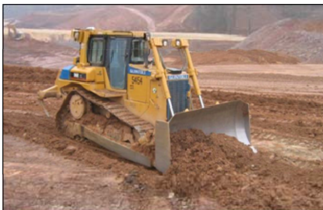
Figure 7 : Bulldozer D6R équipé de scarificateurs en cour de réglage.