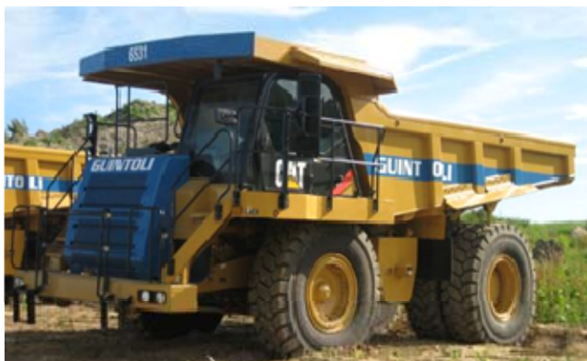
Figure 6 : Dumper rigide 770E en stationnement.