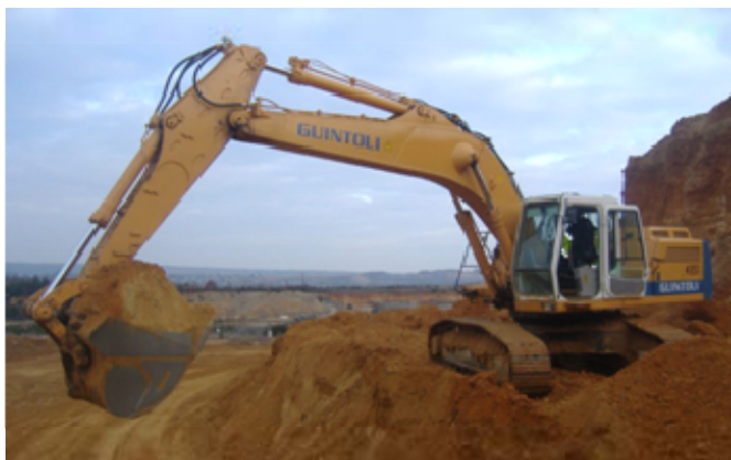
Figure 3 : La pelle 944 en phase de production.