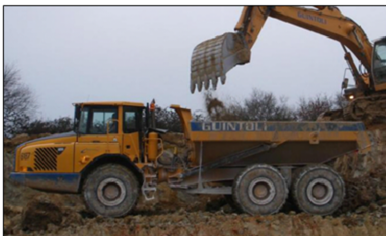
Figure 5 : dumper A25 en cours de chargement.