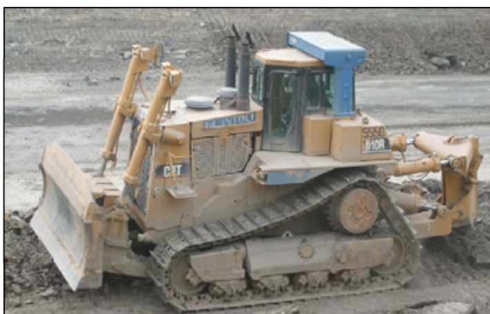
Figure 8 : Bulldozer D10T en cours de ripage.